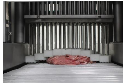
Pisadores independientes con agujas de 30.0 cm de largo.