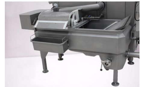
Tanque de recirculación y enfriamiento.