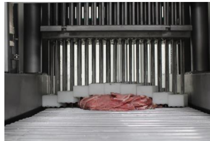
Pisadores independientes con agujas de 30.0 cm de largo.